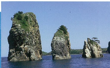
さぶろういわ 三郎岩(海士町)

菱浦港の北東部にある3つの岩で、大きい方から「太郎・次郎・三郎」と呼ばれ、島民から親しまれています。