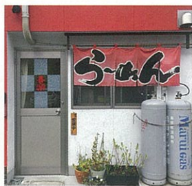
チャーシュー麺…850円