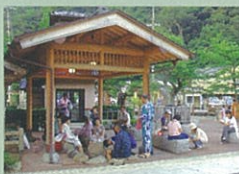
薬師公園ポケットパーク 足湯